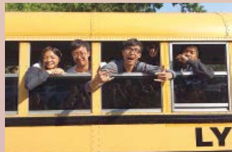
我們齊齊坐上黃巴士

編者：「我和溫哥華之約定」為年度宿生參與海外遊學的體驗，所有開支全由本會自行募集。如有意支持活動，請將支票寄回本會(支票抬頭：香港學生輔助會有限公司；背後請寫上「我和溫哥華之約定」)，讓更多宿生可獲得寶貴的遊學體驗。