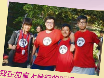
我在加拿大結識的新朋友，大家齊齊穿上「兄弟裝」玩高爾夫球