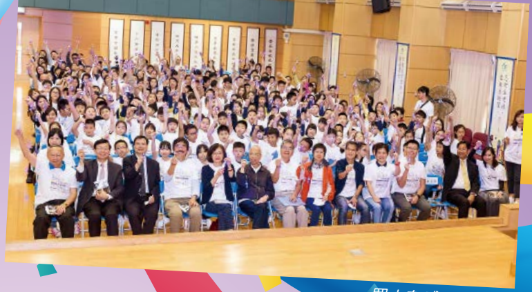
眾人在感恩崇拜後 高舉十字架合照