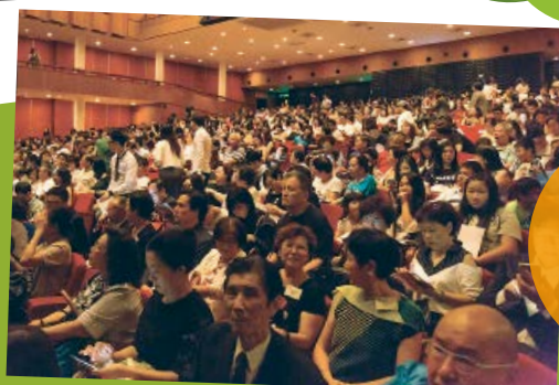
一連三場舞台劇總入場人數近三千人，場面熱鬧