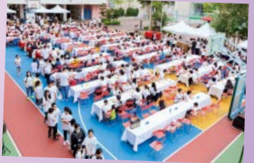
近700人聚首一堂，共慶鑽禧