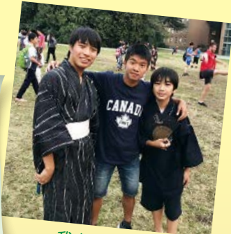
我在旅程中認識了來自日本的新朋友

「今次的旅程是我人生中最多姿多彩的暑假，在此我想特別多謝袁煥森先生。這四星期我體驗了很多精彩難忘的活動，令我獲益良多。更重要的是此行讓我結識了來自世界各地的新朋友！」