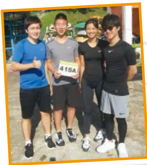
三位馬可宿生與職員組隊，參與水陸歷奇挑戰賽