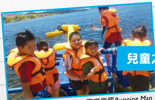
宿生參與水上歷奇活動，齊齊做個 Running Man，藉此建立互信及團隊精神