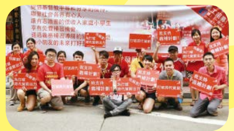
阿○四出招募熱心人士加入義補計劃的行列

及實踐，幫助弱勢社群。「我想透過義補計劃，幫助基層兒童，希望他們成為明日領袖或知識分子，能夠靈活變通，應對瞬息萬變的世界，做個對社會有承擔的人。除了向他們灌輸書本上的知識，我更希望能夠教導他們一些社會技能，擴闊他們的視野和人脈網絡，以生命影響生命。」在阿○身上，除了看到「一團火」外，更看到甚麼叫「白白的得來，白白的捨去」。