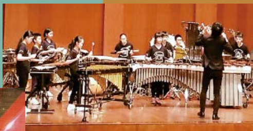
輔小在上海音樂學院精彩又成功的演出