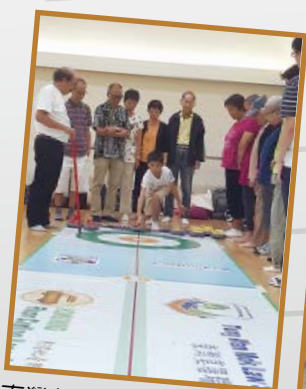
東灣義工隊不怕路途遙遠，遠赴屯門仁愛堂教導長者們玩地壺球