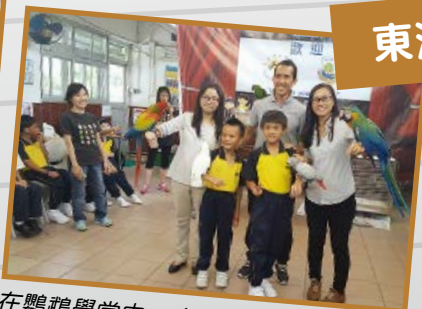
在鸚鵡學堂中，多隻美麗可愛的鸚鵡，為東灣學生帶來無窮的歡樂