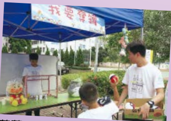
荷蘭宿舍宿生親自設計的 攤位遊戲