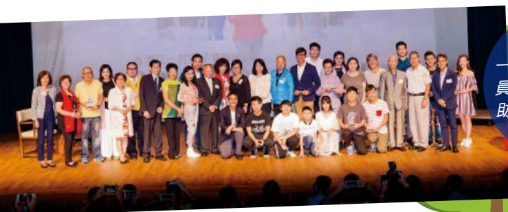
一眾贊助商、演員及香港學生輔助會的代表合照