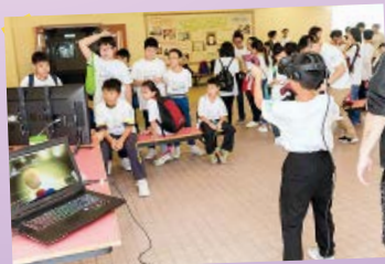
虛擬實景遊戲，小朋友玩得 投入