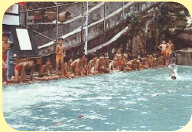
馬可紀念之家在搬遷前位於調景嶺，宿舍有泳池、籃球場等設施