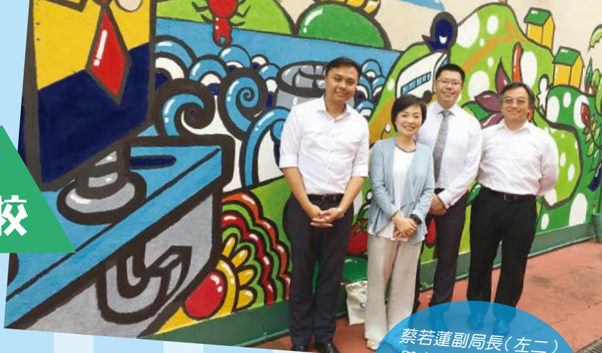
蔡若蓮副局長(左二)與宿舍院長(左一)及學校校長(右二)在壁畫前留影

暑假期間，颱風天鴿及帕卡先後吹襲香港，學校及宿舍備受破壞，多棵大樹倒塌，護土牆破裂，課室的屋頂和足球場的鐵絲網圍欄也被壓毀，校園頃刻變成廢墟一樣。幸好，學校上下一心，親力親為做好善後工作，加上教育局的全力支援，學校終完成清理工作，學生可如期舉行開學禮。