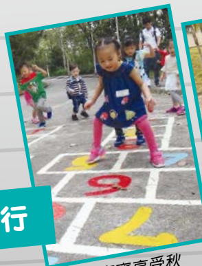
幼兒們齊齊享受秋遊的樂趣