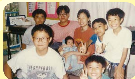
阿O(後排右二)曾與哥哥一同入住馬可紀念之家

以前馬可紀念之家有泳池、球場，不少宿生都愛去那裏游水和踢足球，為他們留下不少難忘的回憶。而且，宿舍每年都會舉辦多姿多采的活動，藉此發掘宿生的潛能。但性格文靜的阿O卻對這些活動興趣缺缺。阿O分享：「我無論讀書抑或運動都無樣精，所以但凡與競技有關的活動我都很少參與，更多的時間是自顧自地在宿舍砌Lego，又或坐在球場一角睇波，因為我喜歡靜下來細心觀察身邊的事物，自得其樂。」雖然如此，阿O卻難忘他小五那年的暑假，在宿舍導師推薦下，參加了為期五天的「港日兒童交流計劃」。那次是他首次離開香港，親身體驗其他地方的生活文化。