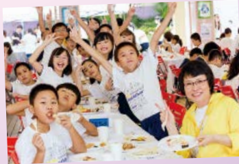
師生一同聚餐，食得開懷