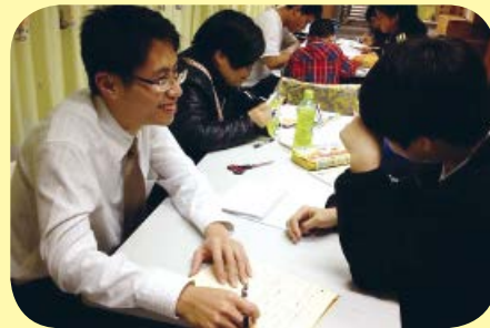
義補計劃的義工每星期都會為基層學生免費補習

中。義補計劃是透過每星期一次，每次兩小時的專科（英、數）補習，幫助基層的小學生。補習以小組形式進行，補習的導師全是義務的熱心人士，當中有的是專業人士，有的是大學生。迄今義補計劃共開了13班，已有百多名兒童受惠，逾百名義工亦得著助人的快樂。