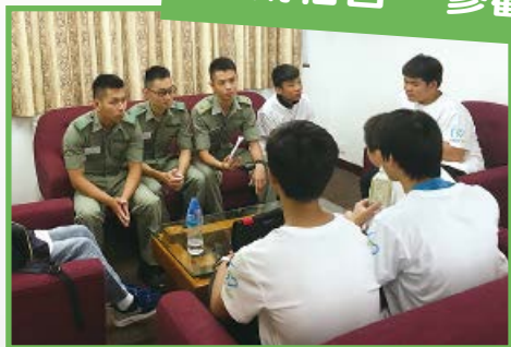
宿生向現役警員積極發問，了解警隊工作的點滴