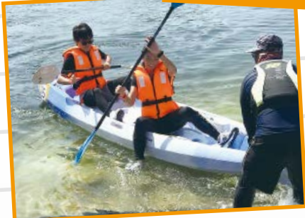
參加者需進行跑步和雙人獨木舟接力賽。最終雖未能勝出，但也是個很好的體驗