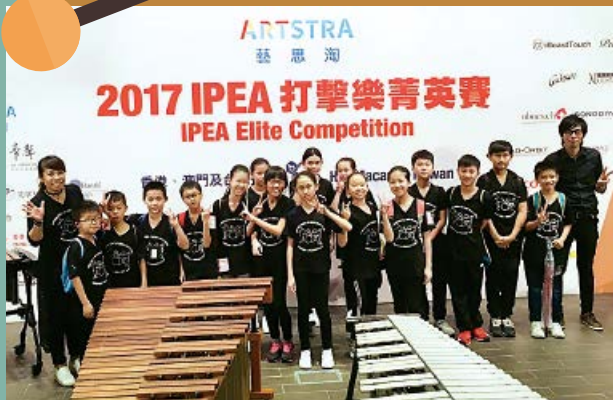
輔小憑著團隊合作的精神，在「2017 IPEA 打擊樂菁英賽」(香港台賽區)中取得一等獎及季軍

本會十分感謝「盧戴曼華基金」贊助部份行程費用，讓輔小學生能衝出香港，參加國際賽事，與不同地方的參賽者進行音樂藝術的交流。