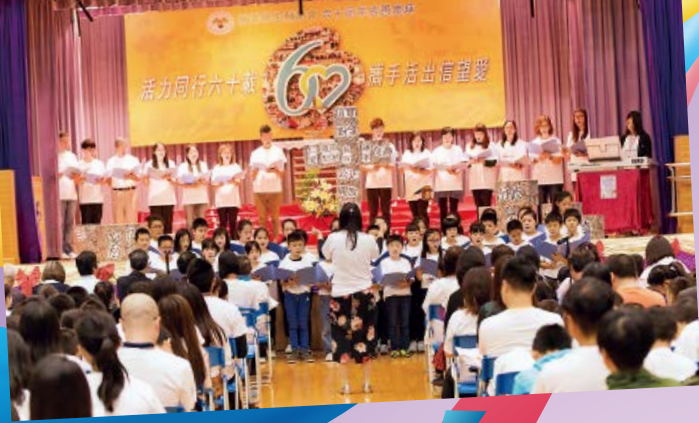
眾人在感恩崇拜中 唱詩讚美上帝