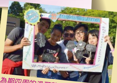
為期四周的溫哥華遊學體驗，令我樂而忘返