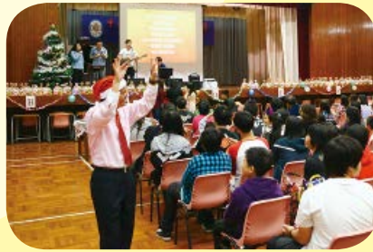
「一團火」每年都會舉辦聖誕聯歡會，與學生、家長及義工們一同唱詩，歡渡佳節

家舍的導師和宿生經常一起晚禱及唱詩，不知不覺把信仰的種子撒在阿○心中。「在我快要離開馬可紀念之家時，對將來忽然有種莫名的恐懼，結果我跟當時的宿舍導師返教會，認識主耶穌基督。信仰令我心中充滿平安的感覺，將過去的恐懼和空虛感一掃而空。」阿○在小六畢業後離開宿舍回家居住，但家中的情況沒多大改善，依舊一屋都是垃圾，垃圾堆到上天花。阿○升上初中時，朋友不多，最要好的朋友就是「收音機」。