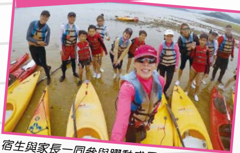
宿生與家長一同參與躍動成長訓練計劃，共享難能可貴的親子時光