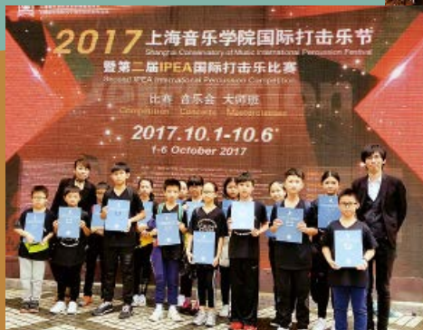
輔小在「2017 IPEA 上海音樂學院國際打擊樂節」(全中國)中勇奪亞軍