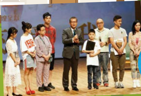
財政司司長陳茂波撥冗到場欣賞舞台劇