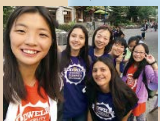
我結識了來自墨西哥及日本的朋友，大家結伴去購物和吃晚餐

「在短短的四個星期中，不只是學習用英語溝通，更重要的是學習在文化差異中與人相處。我們一群新相識的朋友的共同的語言就是英語，但由於不是我們的母語，誤會在所難免；但我們仍可以有說有笑，也不介意被誤會或被嘲弄。溫哥華之旅擴闊了我的眼界，也增進我和和新朋友的情誼。我學懂了一點日語、西班牙語和波斯文，說英語的信心也增強了。」