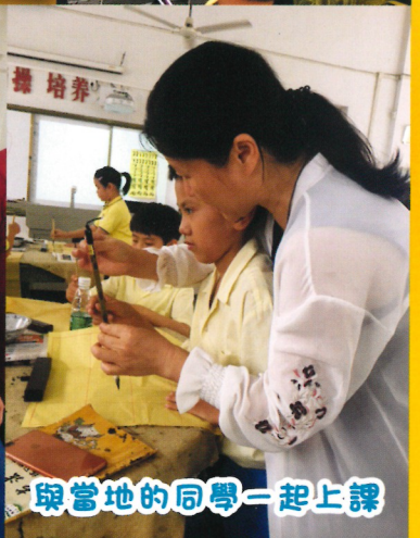
與當地的同學一起上課