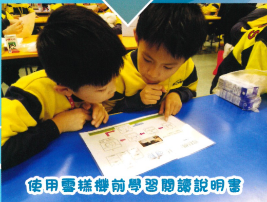
使用雪糕機前學習閱讀說明書