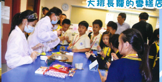
大排長龍的雪糕店