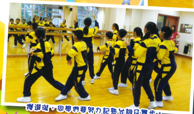
獲選後，同學們要努力記熟台詞及舞步。