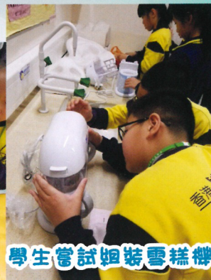
學生嘗試組裝雪糕機