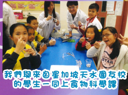
我們與來自星加坡天水圍友校的學生一同上食物科學課