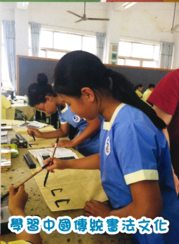
學習中國傳統書法文化