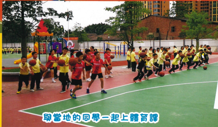
與當地的同學一起上體育課