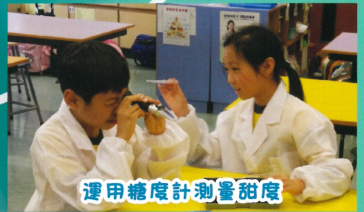
運用糖度計測量甜度