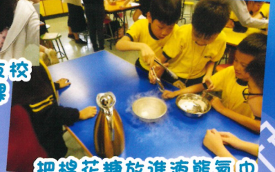
把棉花糖放進液態氮中會有什麼結果呢