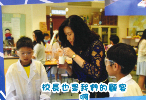
校長也是我們的顧客啊