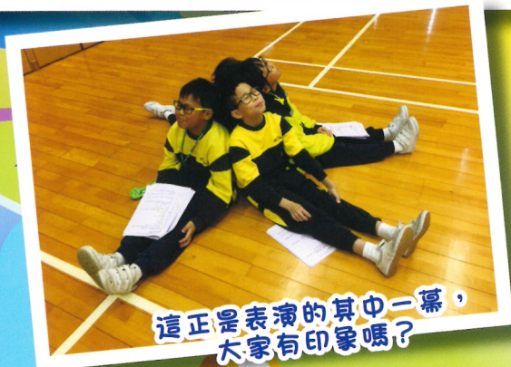
這正是表演的其中一幕，大家有印象嗎？

還記得當晚有型有格的戲服嗎？其實是裁縫師精心為同學度身訂造的，每件都獨一無二。為我們在「未來世界」上做準備。