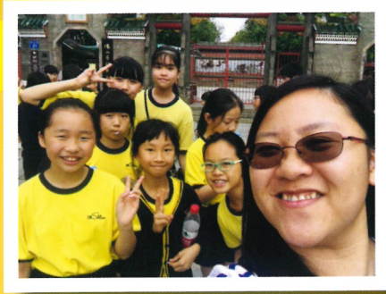
我和老師的快樂時光

本校經常與外地學校有交流活動。是次目的地為佛山。兩日一夜的時間雖短，但同學獲益良多，尤其是團內有三、四年級的同學，他們的自理能力也有提升。除了參觀佛山景點，認識當地文化，適逢【佛山科學技術學院附屬學校(南莊小學)】舉行才藝表演活動，本校的管樂團及跳繩隊都有參與。