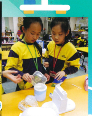
把雪糕漿倒入雪糕機