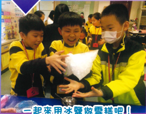
一起來用冰鹽做雪糕吧!