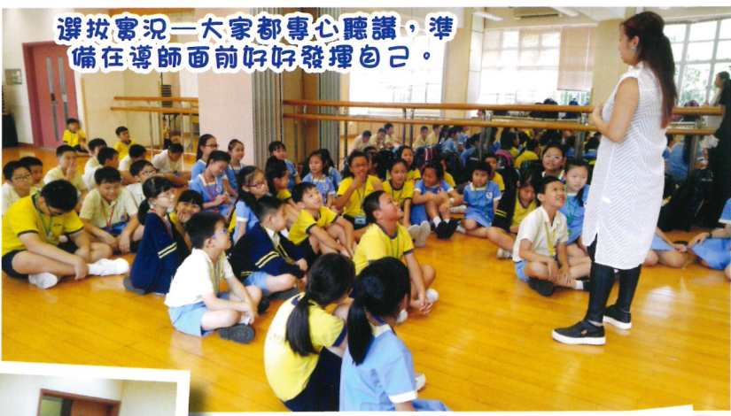
選拔賽況—大家都專心聽講，準備在導師面前好好發揮自己。