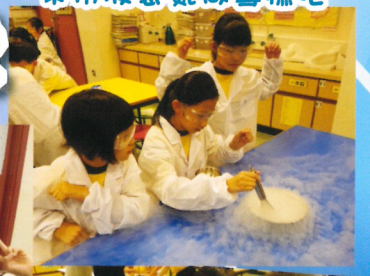
來用液態氮做雪糕吧