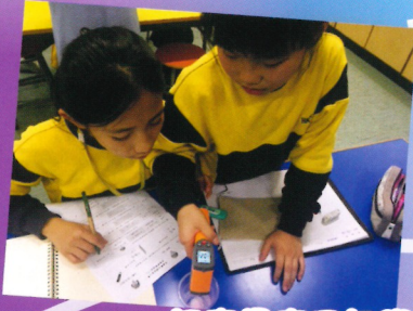
認真量度及記錄實驗結果