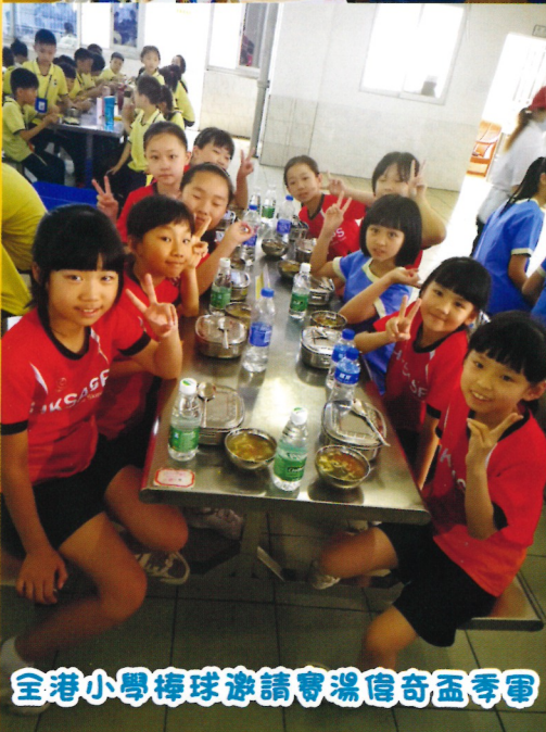
全港小學棒球邀請賽溫偉奇盃季軍