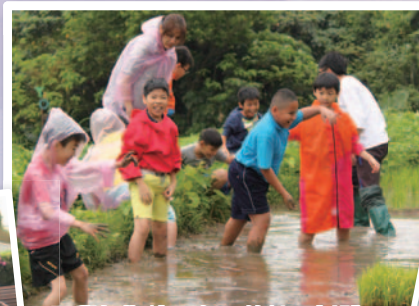
同學們期待已久，終於可以體驗泥漿的感覺。