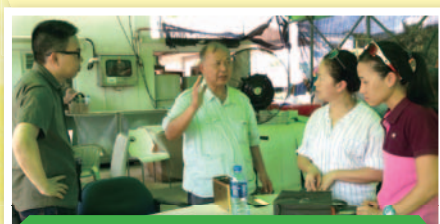
石先生的分享，讓我們大開眼界。