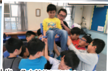
一人出一分力就能把事情完成，加油！