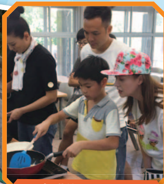
午膳就拜託你們了!