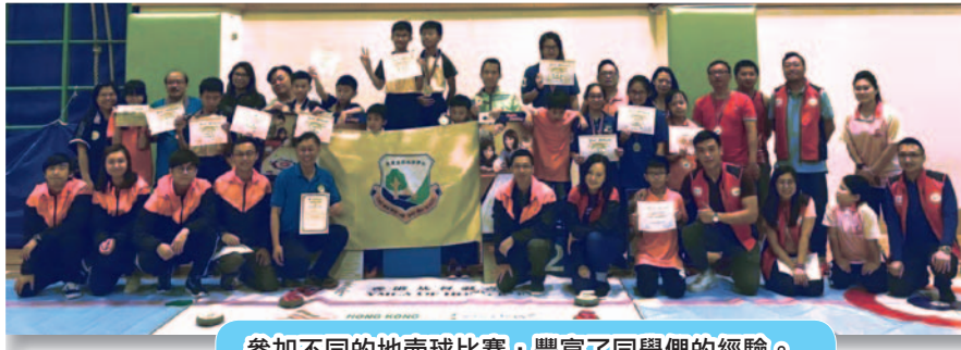
參加不同的地壺球比賽，豐富了同學們的經驗。