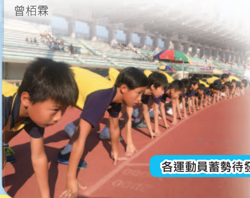
各運動員蓄勢待發！