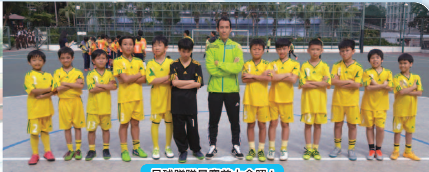
足球隊隊員賽前大合照！