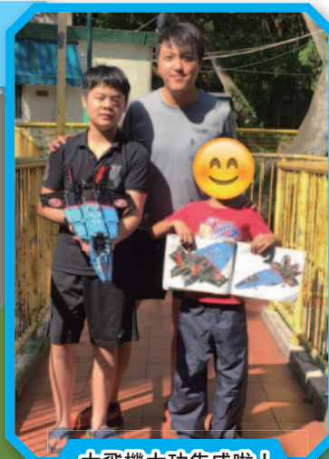
大飛機大功告成啦！