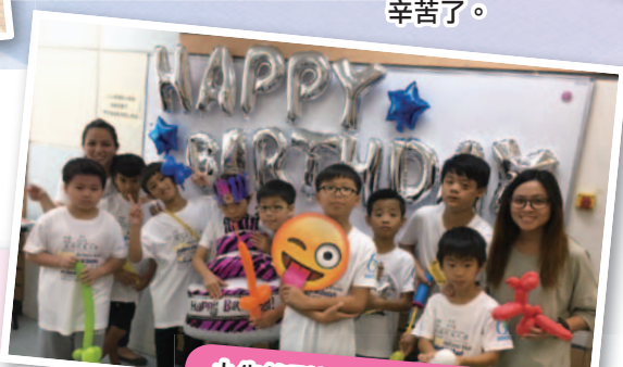
小先鋒到社區中心協助生日會的進行。

宿舍的暑期活動動靜俱備，正好符合我們宿生不同的需要，每一位都享有學習與嘗試的機會，過了一個不一樣的暑假。