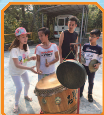
少獅隊與義工隊分享心得