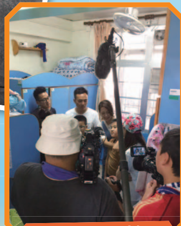
小導遊向藝人們介紹