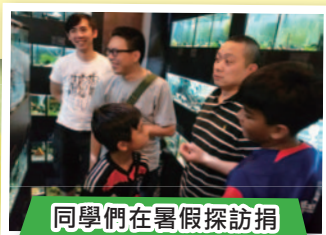
同學們在暑假探訪捐 贈人士的店舖，從中 學習如何飼養螞蟻。