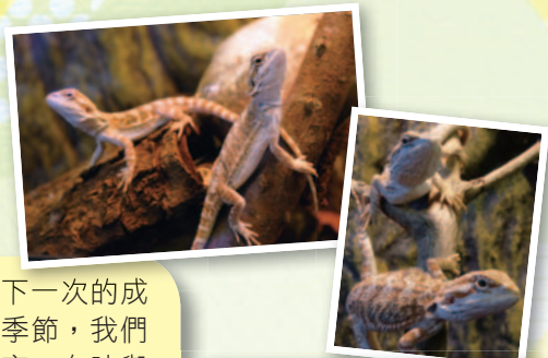
牠們的神態已謀殺了不少 菲林，只可遠觀，不可褻 玩焉。

這個暑假的驚喜一浪接一浪。暑假前，我們幾位教師有機會前往石鏡泉先生的農場進行參觀，學習如何利用科學的方法耕種，此行獲益良多。另外，東灣得到許多熱心人士的支持和捐贈，增添了不少新成員，例如：繫獅蜥、變色龍、刺蝟和珊瑚魚缸等。為了迎接這個轉變，在圖書館設置了大自然閣，環境煥然一新。學生不僅可以觀察和打理不同的小動物，還能借閱相關圖書，進行分享和探究活動。學生更有機會利用科學化的方法飼養小動物和耕種，豐富了大自然科的教材。