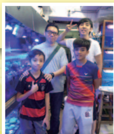
同學在崔先生的 店舖內拍照留念。