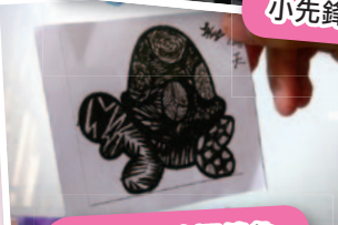
自家創作的禪繞龜。