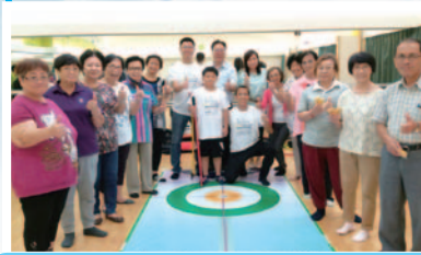
同學於體育學院比賽，家長到場打氣。

我們深信在東灣推展地壺球活動，可以： 為學生及家長提供老幼皆宜的共融活動！ 建立學生們的自信心！ 增強學生解決問題的能力！ 提升學生逆境智商及成功感！