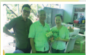
回去後，便要動手建設 「大自然」閣了。