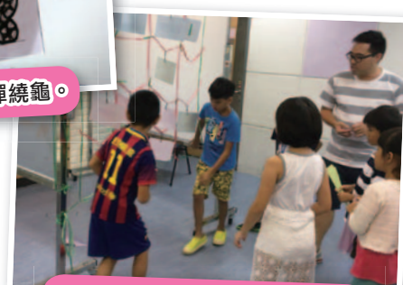
看他們多認真地講解活動規則。