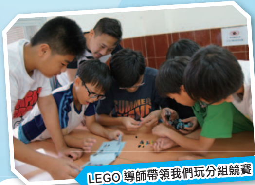
LEGO 導師帶領我們玩分組競賽