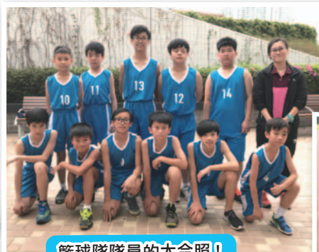
籃球隊隊員的大合照！