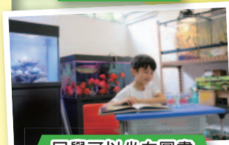
同學可以坐在圖書 館內查找資料。