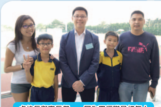
卓校長與家長們，一同為田徑隊員打氣！