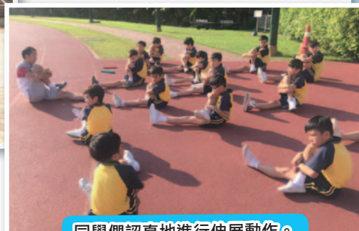
同學們認真地進行伸展動作。