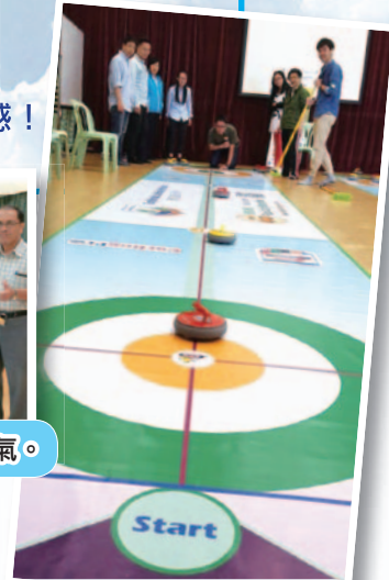
在教師專業發展日安排全體教職員體驗地壺球的樂趣。