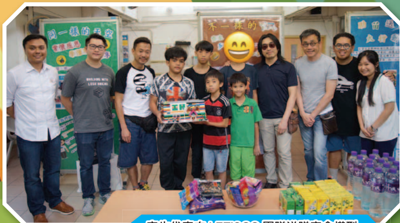
宿生代表向 LET'SGO 團隊送贈宿舍模型