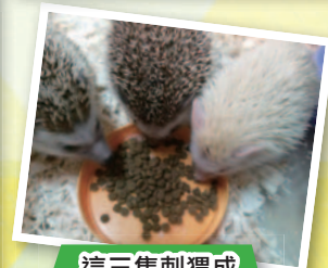
這三隻刺蝟成了 東灣新寵。