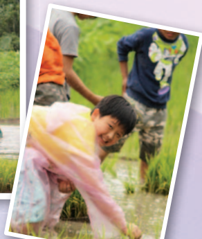
終於明白到農民伯伯的辛苦了。