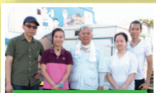
此行獲益良多，豐富 了我們的教學內容。

如今，我們在每周的自主課節中，都設有科學堂，把「砌模型」納入校本課程之中，讓學生找到愉快的大門，走進奇妙的科學世界。