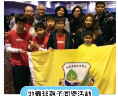
地壺球親子同樂活動